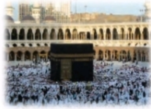
( الطواف )