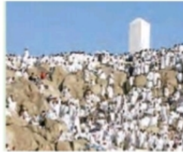
( رمي الجمرات )