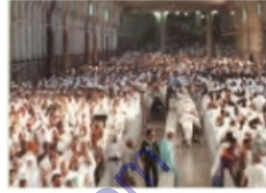
(السعي بين الصفي والمروة)

رابعاً: اكتب الأعمال التي يقوم بها الحاج :